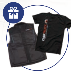
PRSLUK + T-SHIRT

Kupnjom KNORR-BREMSE proizvoda u ukupnom iznosu iznad 5.000 kn