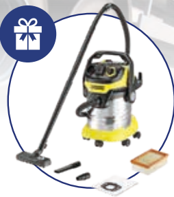
VIŠENAMJENSKI USISAVAČ KARCHER WD 6 PREMIUM EXTENSION

Kupnjom KNORR-BREMSE proizvoda u ukupnom iznosu iznad 20.000 kn