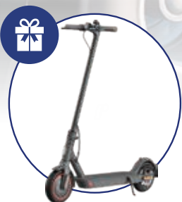
XIAOMI MI ELEKTRIČNI ROMOBIL PRO2

Kupnjom KNORR-BREMSE proizvoda u ukupnom iznosu iznad 40.000 kn